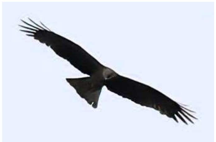
Zwarte wouw