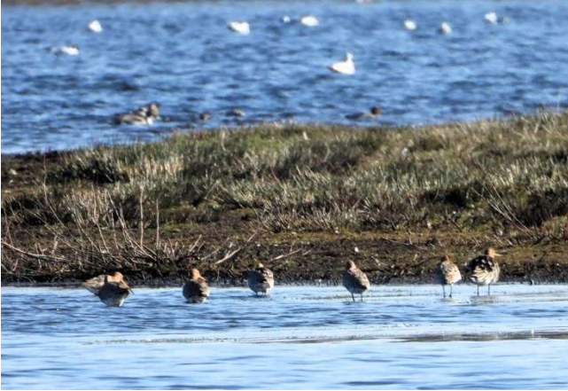
Wulpen bij het Beleven