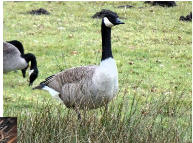
Grote Canadese gans