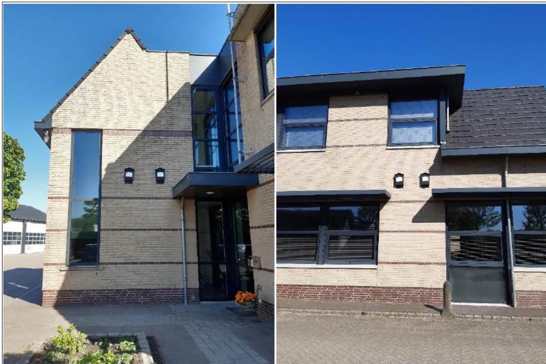
Figuur 3. Locaties van de tijdelijke vleermuiskasten voor de gewone dwergvleermuis aan het kantoorpand gelegen aan de Postelsedijk 2b.