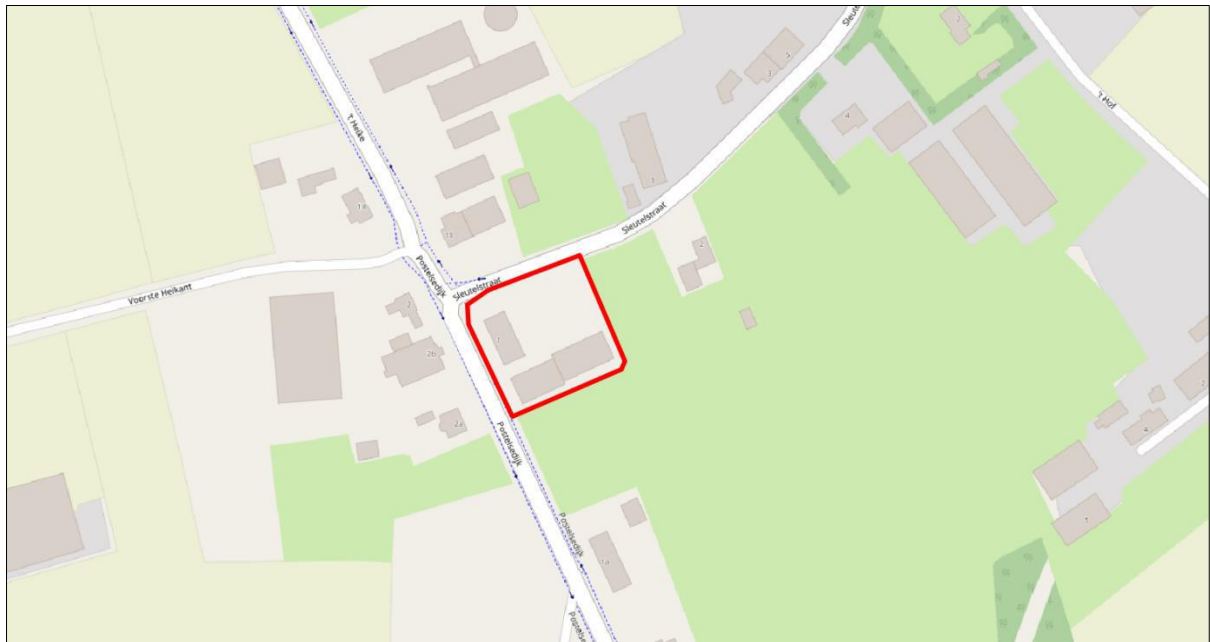
Figuur 1. Locatie Postelsedijk 1, 5541 NM te Reusel. De activiteiten vinden plaats binnen het rood omlijnde gebied.